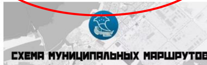
СХЕМА МУНИЦИПАЛЬНЫХ МАРШРУТОВ

ТЕРРИТОРИЯ ОПЕРЕЖАЮЩЕГО СОЦИАЛЬНО-ЭКОНОМИЧЕСКОГО РАЗВИТИЯ НАБЕРЕЖНЫЕ ЧЕЛНЫ