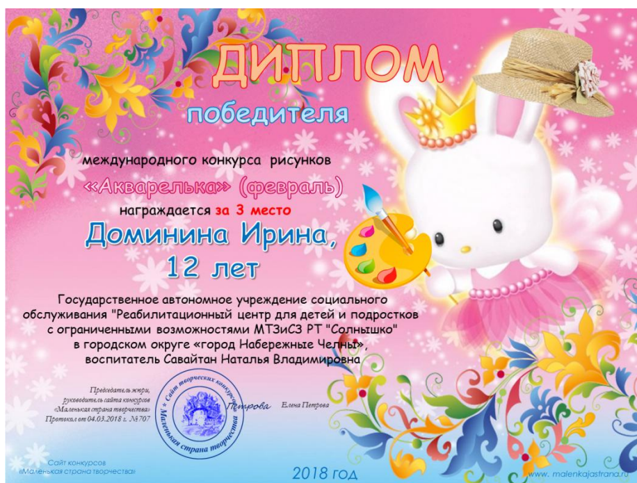
Международный конкурс рисунков «Акварелька»