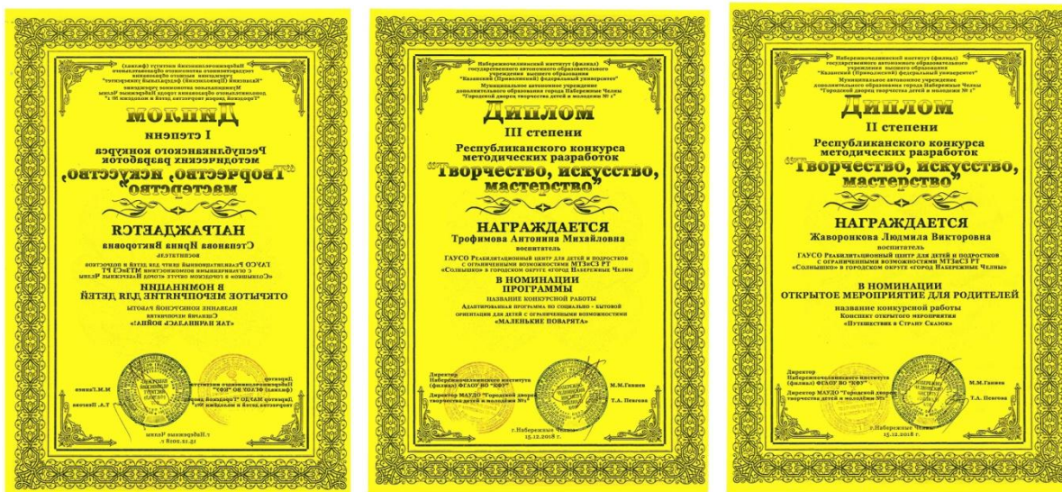
Открытый региональный конкурс методических разработок «Творчество, искусство, мастерство»