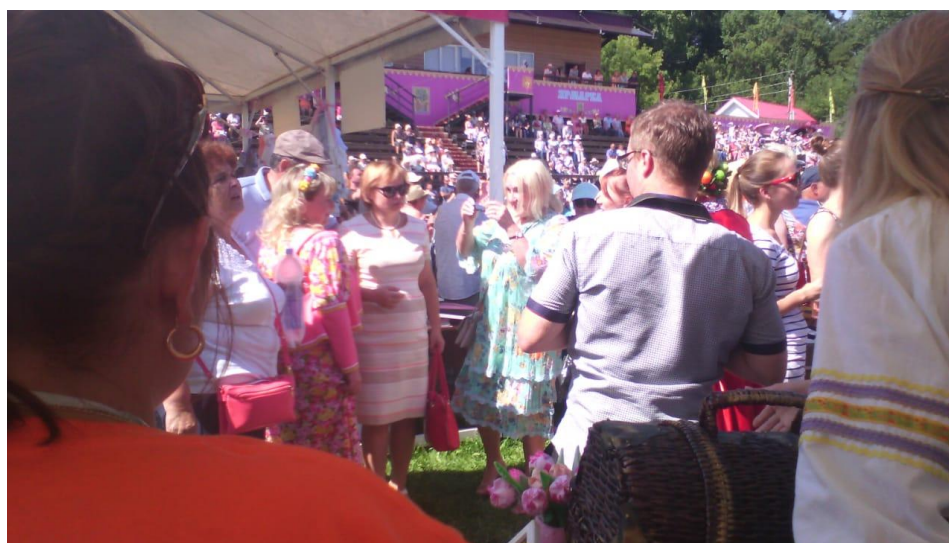
XI Всероссийская Спасская ярмарка в Елабуге