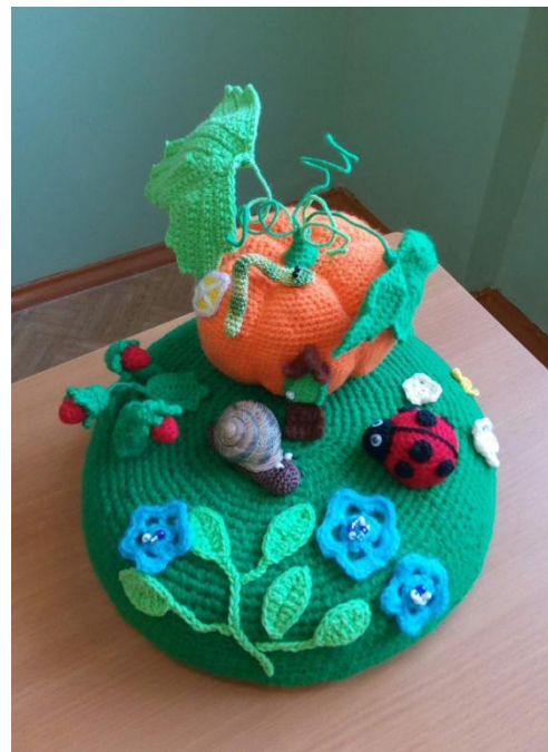
Международный творческий фестиваль детей с ОВЗ «Шаг навстречу!»