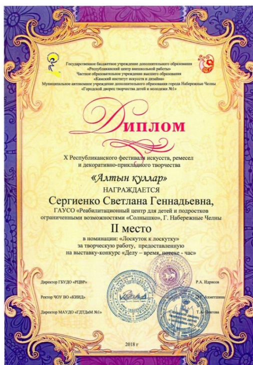
X открытый республиканском фестивале искусств, ремесел и декоративно-прикладного творчества «Алтын куллар»