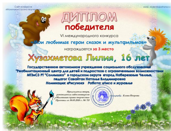
VI международный конкурс «Мои любимые герои сказок и мультфильмов»